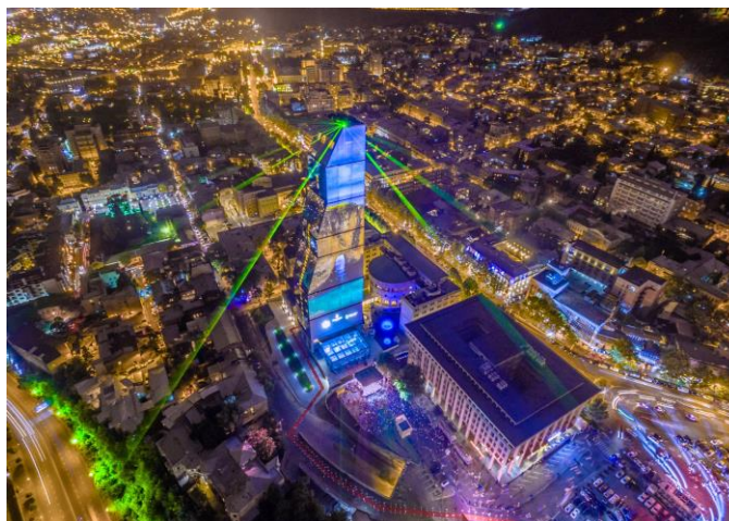
Biltmore Hotel- Tbilisi

Compania este contractor general cu lucrari structurale pentru un complex mixt de dimensiuni mari, care include un hotel cu 14 etaje, o cladire rezidentiala cu 19 etaje, un restaurant si un centru spa: Hilton Garden Inn (Tbilisi) . Cladirile vor fi construite deasupra unei parcuri cu 4 nivele subterane si vor acoperi o suprafata de 39,000 mp. Acesta este al doilea proiect care include un hotel, executat de SYNERGY in Tbilisi, dupa ce compania a livrat in 2015 lucrarile structurale pentru un zgarie nori din sticla de 150 m: Biltmore Hotel (Tbilisi).