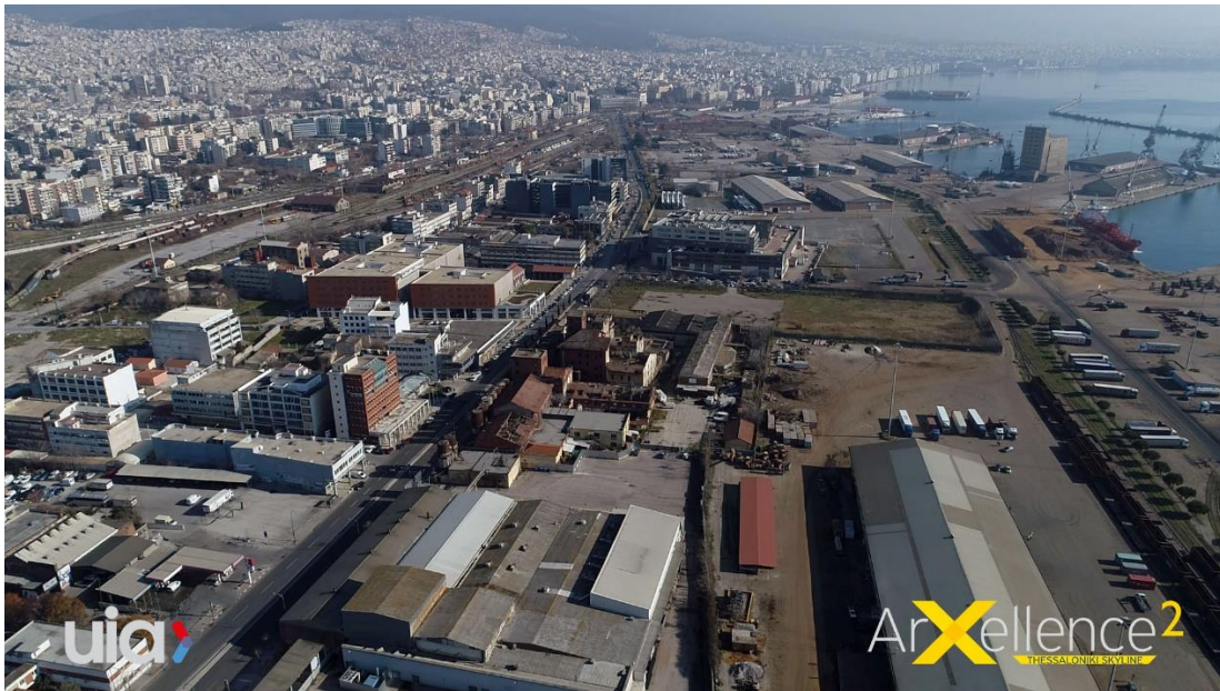
Latura de vest din Salonic, zona competiţiei

Mai mult, zona va fi semnificativ revitalizata odata cu finalizarea marilor proiecte de infrastructura precum modernizarea portului, inaugurarea retelei de metrou din Salonic si a retelei feroviare suburbane de vest. Adicional, pina in anul 2021 va fi finalizata constructia noilor terminale a Aeroportului International din Salonic, transformandu-l intr-un aeroport modern, cu o crestere semnificativa a capacitatii de procesare, conectând oraşul cu intreg mapamondul.