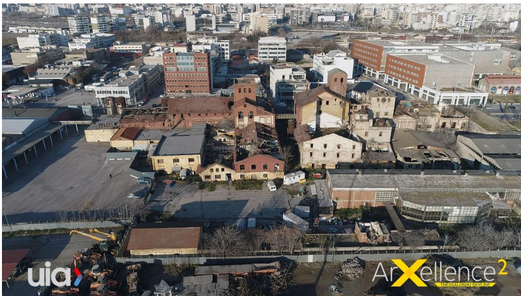
Latura de vest din Salonic, clădiri abandonate

Din păcate, astăzi zona de pe malul vestic este o zonă urbană incomplet utilizată, reprezentând probabil una dintre cele mai subdezvoltate zone ale orașului. Desigur aceasta situație are un impact asupra imaginii, atractivității și productivității metropolei. Inițiativele din trecut menite să faciliteze transformarea zonei într-un pol de dezvoltare urbană nu au adus rezultatul scontat și, astfel, provocarea încă există!